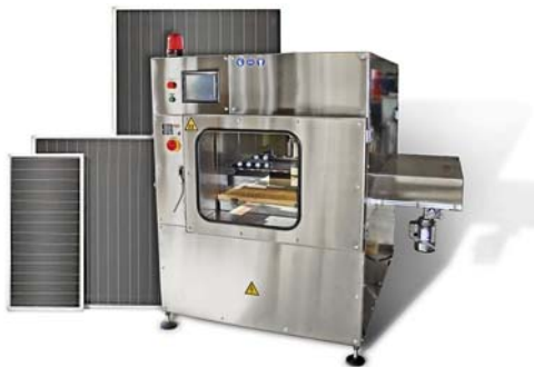
Abb. 4: Sprühanlage für Solarpanel

2008 wird die erste Sprühanlage in der amerikanischen Solarindustrie eingesetzt. Es folgen unter anderem Ofentechnologie, Paternoster und Zwischenlagensysteme (Abb. 4).