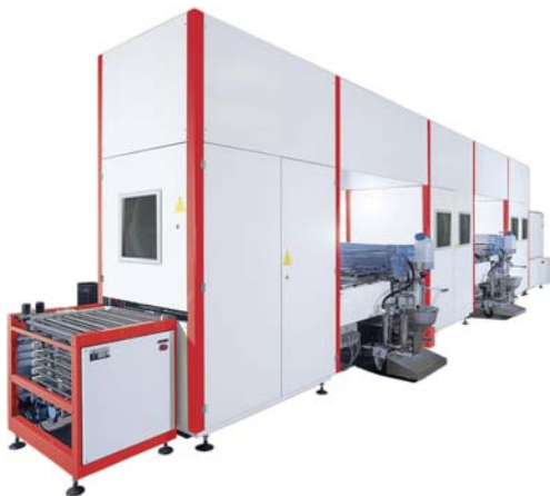
Abb. 2: Compact Lötstopplackgießanlage

Die Lösung für diese drei Probleme war die Entwicklung der im Baukastensystem aufgebauten Compact-Beschichtungsanlage (Abb. 2) durch die Kuster AG . Nur noch 12 m lang mit einem Anschlusswert von 40 KW bis 50 KW war dieser Anlagentyp maßgeschneidert für Probimer und grenzte den Wettbewerb anlagentechnisch aus. Ab 1991 baute die Kuster AG